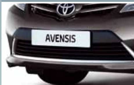
CHROMOWANA LISTWA WLOTU POWIETRZA