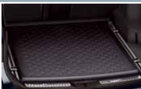
GUMOWA WYKŁADZINA BAGAŻNIKA 1

SEDAN (LUNA, SOL, BUSINESS, PLUS) 1 850 PLN