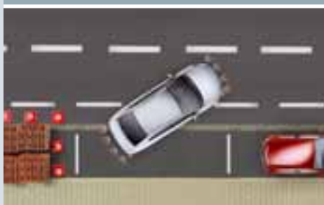
CZUJNIKI PARKOWANIA PRZODEM LUB TYŁEM