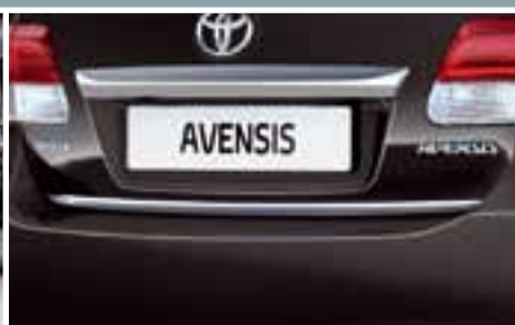
CHROMOWANA LISTWA NA KŁAPĘ BAGAŻNIKA