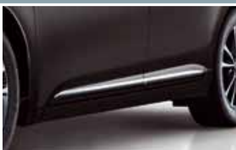
CHROMOWANE LISTWY BOCZNE