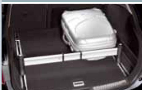
CARGO MANAGER – UCHWYT DO STABILIZACJI BAGAŻU