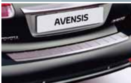
NAKŁADKA OCHRONNA NA TYLNY ZDERZAK